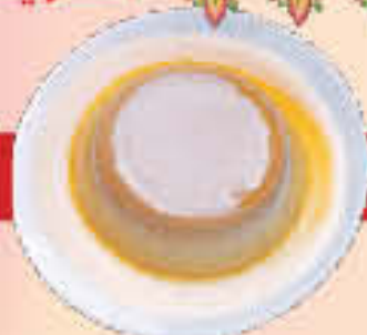
E2 Cream Caramel LE. 30