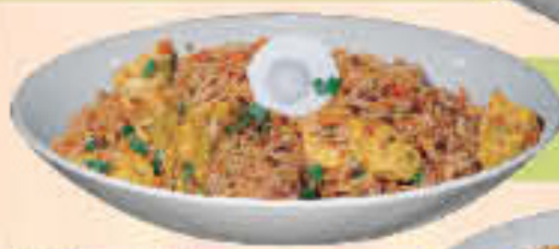
LE. 25 Vegetable Biryani

(Saffron rice cooked with spiced vegetables, yogurt, mint and saffron)