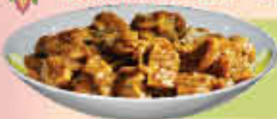
LE. 36 Mushroom Masala

(Mushrooms cooked in saffron/ground masala)