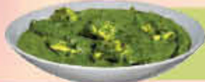
LE. 35 Palak Paneer

(Puree of spinach cooked with paneer and spices)