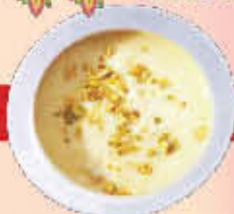
D1 Kheer LE. 30