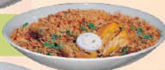
Mutton Biryani LE. 88