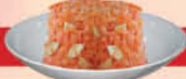
D4 Gajar Halwa LE. 30

جولاب جامون (2 قطعة) | كراتان يامون غسولون من الحليب مسلوحة من القشطة السكرية وقدم مع الشراب