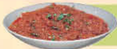
Baingan Bharta LE. 35

(Baked brinjals cooked with chopped onions, tomatoes & variety of spices)