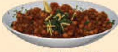
Pindi Chana LE. 35

(An authentic Chik. Peas preparation from the North)