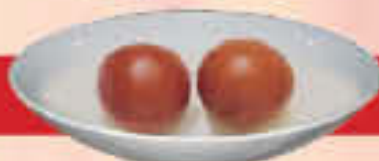
D3 Gulab Jamun (2 Pcs) LE. 30

(Balls of khoya deep fried, soaked in sugar syrup and served hot)