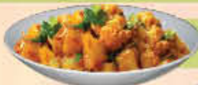
LE. 35 Aloo Gobi

(Cauliflower florets cooked with potatoes and tempered with tomatoes and green chilies)