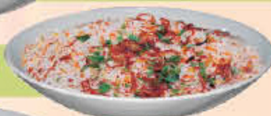
Fish Biryani LE. 60

(Succulent pieces of fish steamed with saffron rice and spices, served with fish gravy)