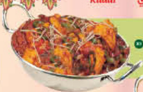
Chicken Kadai Lajwari LE. 55