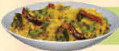
PILLI DAL TARKA LE. 25