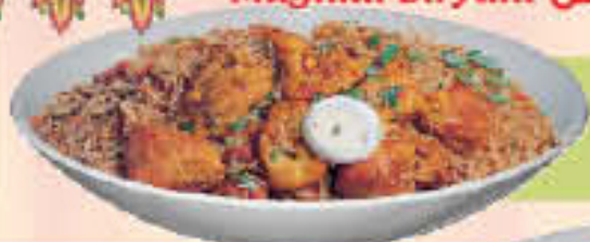
Chicken Biryani (Dum-dum)

(Saffron rice cooked with spiced chicken, yogurt and saffron)