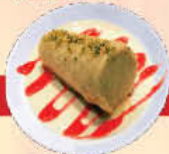
D5 Kullfi LE. 30

Ask for Ice Cream Momo إيمان من قائمة الايس كريم