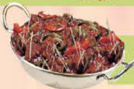
Mutton Kadai Dagbari LE. 55

(Marinate of marinated lamb cooked with Julienne of green pepper, tomatoes, dried Mango powder and salt peas, garnished with Julienne of ginger)