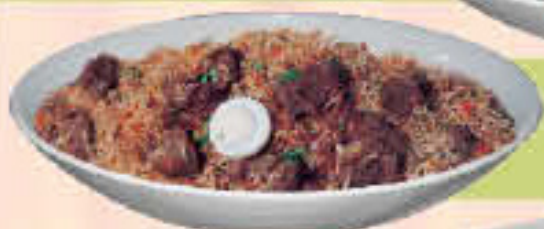
Saffron Pulao Rice