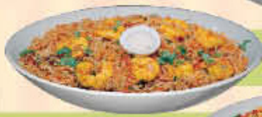
LE. 25 Biryani Rice Plain

(Saffron, saury flavoured rice garnished with fresh coriander & chopped tomatoes)