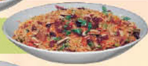
Shrimp Biryani LE. 75

(Saffron flavoured rice cooked with shrimp and saffron)