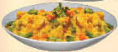
LE. 35 Navratan Korma

(Seasonal Vegetables Greened in rich Creamy Nut Sauce)