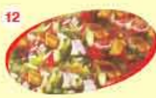
12 0.850 سلطة فتوش Fattoush Salad