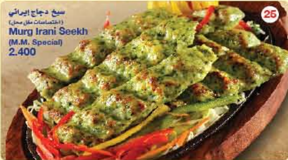
سبخ دجاج ايراني (اختصاصات مقل محل) Murg Irani Seekh (M.M. Special) 2.400