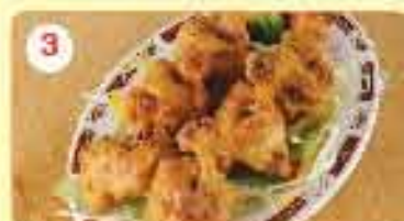
3 1.250 أجنحة دجاج مقلية Chicken Wings