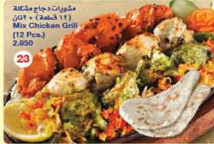
مشويات دجاج مشكلة ( 12 قطعة ) + 2 نان Mix Chicken Grill (12 Pcs.) 2.950