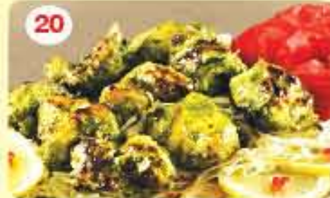
20 تكا دجاج كانداري Murg Tikka Khandari 2.400