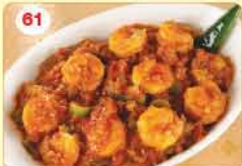
61 Prawn Masala 2.900 مرق رويان مسالو