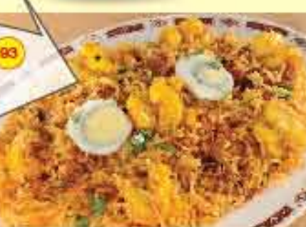
Special Jumbo Prawns Biryani (7pcs) Served with Gravy جمبو برياني روبيان (7 قطع) 4.850 يقدم مع الصلصة