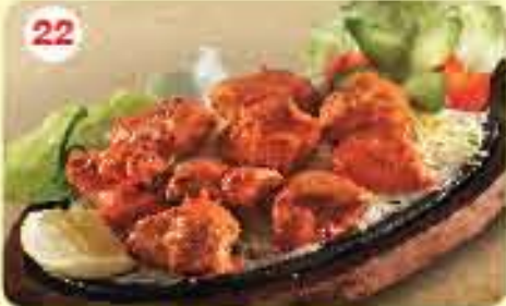
22 شيش طاووق تاندوري Nawabi Murg Ke Tikke 2.400