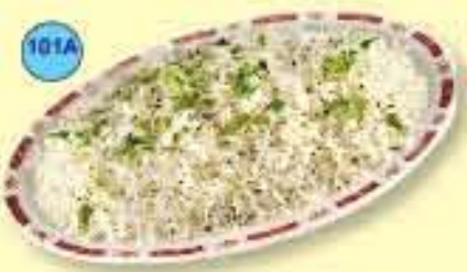
Jeera / Garlic Rice ارز بالثوم أو الكومون 1.150