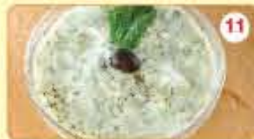
11 0.750 سلطة زوب Yoghurt Salad