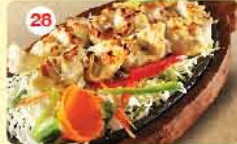
28 تكا دجاج بالثوم Garlic Tikka 2.400