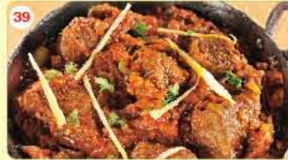
39 Kadai Gosht 2.350 ڪراي جوشٽ