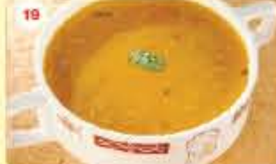
19 0.900 شوربة هديس Addas (Oriental Inavourite)