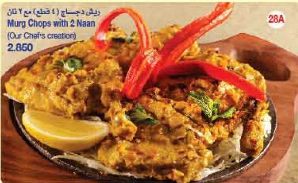
ريش دجاج ( 4 قطع ) مع 2 نان Murg Chops with 2 Naan (Our Chef's creation) 2.850