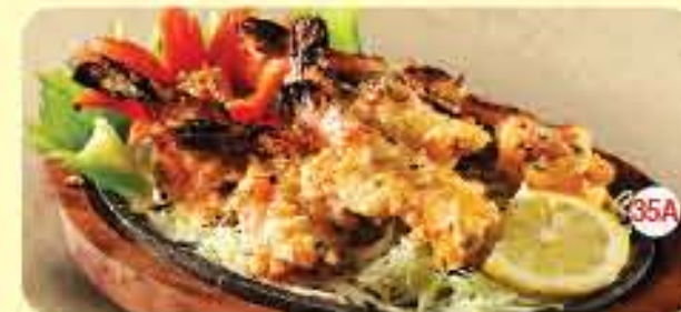
جمبو روبيان مهلي مع الثوم ( 7 قطع ) Mahabali Garlic Prawns (7Pcs.) 4.650