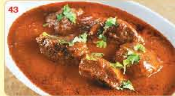
43 Roganjosh (Specialty of Kashmir) 2.200 ڪاري لحم غنم روچانجوش