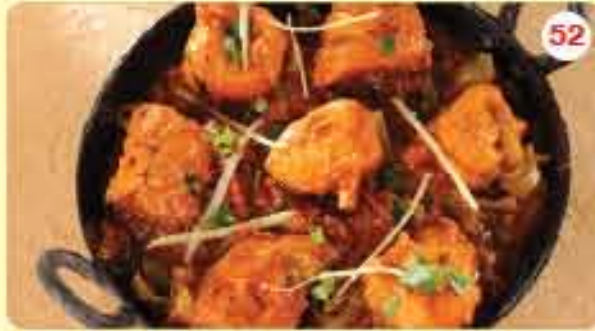
52 Kadai Chicken Boneless 2.450 ڪراي دجاج