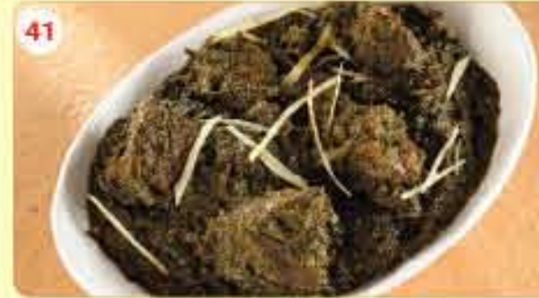
41 Saag Gosht 2.400 لحم بالسبانخ بدون عظم