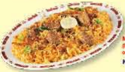
Mughlai Mutton Biryani (Specialty from Hyderabad) (Basmati rice cooked with spiced lamb, yoghurt, and Saffron) برياني لحم 2.000