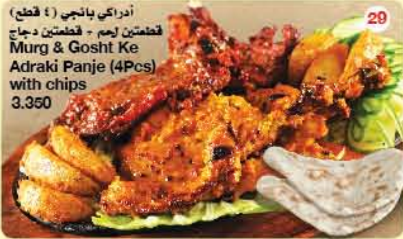
آدراكي بانجي ( 4 قطع) قطعتين لحم - قطعتين دجاج Murg & Gosht Ke Adraki Panje (4Pcs) with chips 3.350