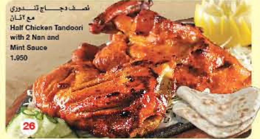
نصف دجاج تاندوري مع 2 نان Half Chicken Tandoori with 2 Naan and Mint Sauce 1.950