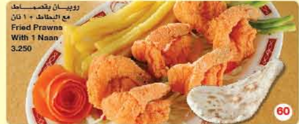
روبيان بقصصاط مع البطاط + 1 نان Fried Prawns With 1 Naan 3.250