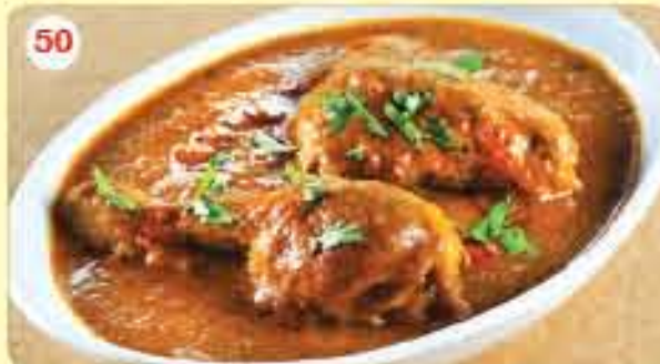
50 Chicken Curry 1.900 ڪاري دجاج بالعظم