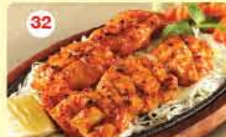
تكا سمك جهانجيري Macchi Tikka Jahangiri 2.750