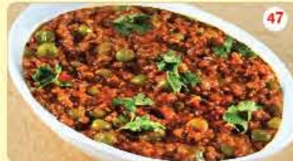
47 Keema Matar 1.850 ڪيما مع البازيلاء