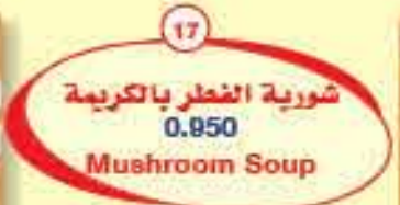
17 0.950 شوربة الفطر بالكريمة Mushroom Soup