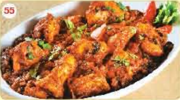
55 Murg Multani 2.350 دجاج مولتاني