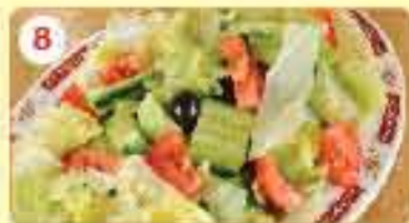
8 0.850 سلطة خضراء مشككة أو بالمايونيز Oriental Salad or with Mayonnaise