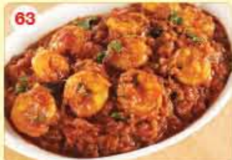
63 Prawn Multani 2.900 رويان مولتاني