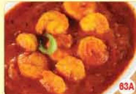
63A مرق رويان 2.850