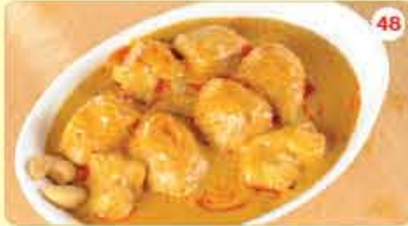
48 Chicken Korma 2.450 دجاج ڪورما