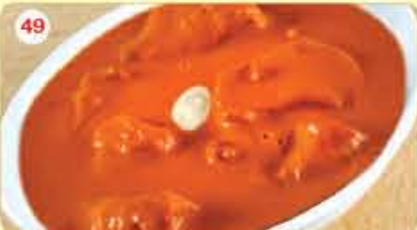
49 Butter Chicken 2.400 دجاج مخني