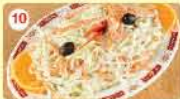
10 1.000 سلطة ملثوف بالمايونيز Cabbage Salad with Mayonnaise