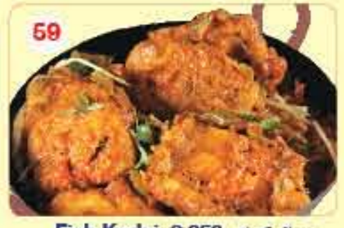
59 سمڪ ڪراي 2.850 59A مرق سمڪ 2.750