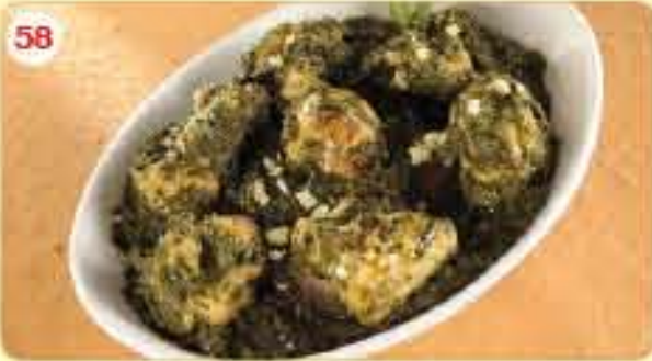
58 Chicken Palak 2.400 دجاج بالسبانخ بدون عظم