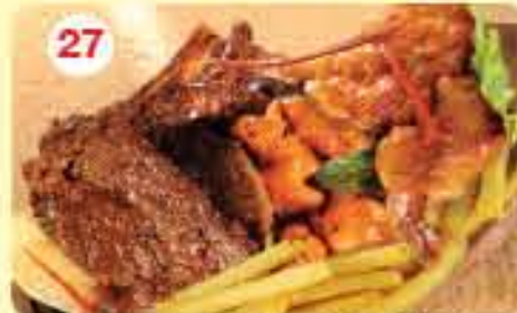
27 وجبة خاصة مشويات مشكل مع شيس قطعتين ريش لحم + 4 قطع شيش طاووق + 3 قطع روبيان Mixed Platter with Chips 3.950 3Pcs Prawns + 2Pcs lamb chop + 5Pcs Nawabi Tikka