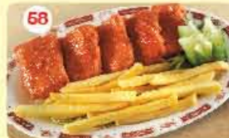
سمك مقلي Fried Fish Boneless 2.600