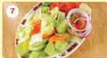
7 0.850 سلطة خضراء مشككة Mix Green Salad