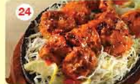
24 تكا دجاج آچار Achari Tikka 2.400