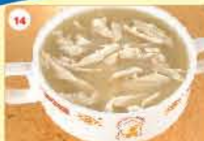
14 0.950 شوربة الدجاج بالكريمة Jahangiri Soup