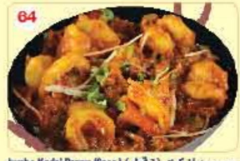
64 Jumbo Kadai Prawn (6 pcs.) 4.650 ڄمبورويان ڪراي (6 قطع) ٽڪم مع العيش