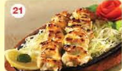
21 دجاج سينا مالوي Murg Seena Malai 2.400