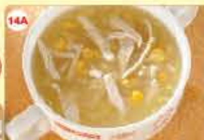
14A 0.950 شوربة دجاج بالذرة Sweet Corn Soup (Chicken or Veg.)