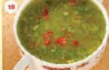
18 0.950 شوربة خضار Veg. Soup