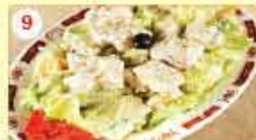
9 1.950 سلطة سيزر مع الدجاج أو الخضار Caesar Salad with Chicken Or Veg.