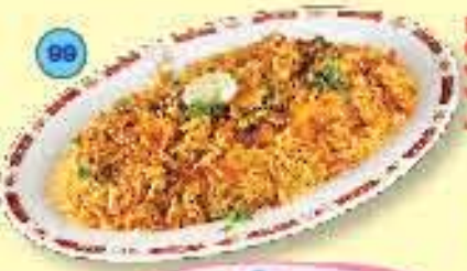
Fish Machli Biryani (Boneless pieces of fish steamed with Basmati rice and spices, served with fish gravy) برياني سمك 2.200