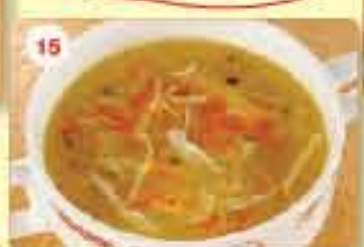
15 0.950 شوربة مل جتواني Mulligatawany Soup