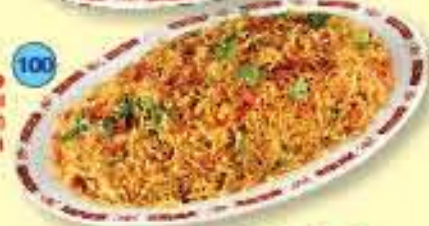
1.250 Biryani Rice (Saffron, curry flavoured rice garnished with sliced onions & chopped coriander) ارز برياني سادة