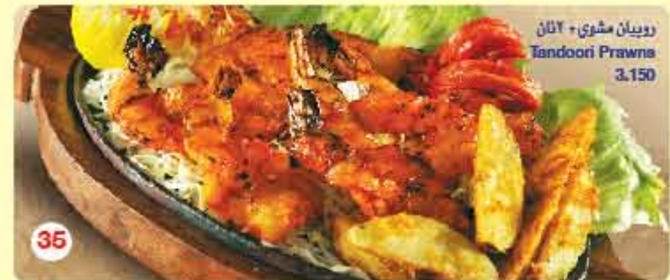
روبيان مشوي + 2 نان Tandoori Prawns 3.150