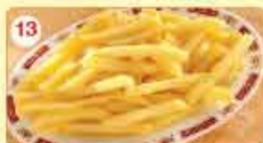
13 0.750 شيس Chips