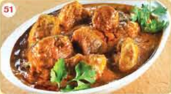
51 Chicken Curry (Boneless) 2.150 ڪاري دجاج (بدون عظم)