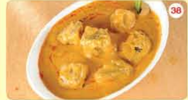
38 لحم غنم ڪورما 2.450