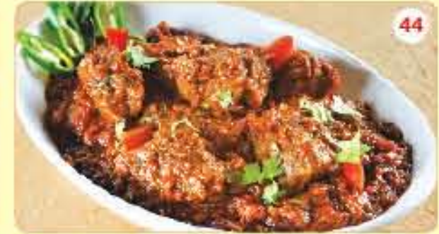
44 لحم غنم مسالو 2.400