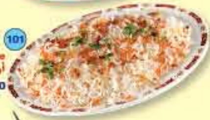
Plain Pulao Rice ارز أبيض بالزعفران 1.150