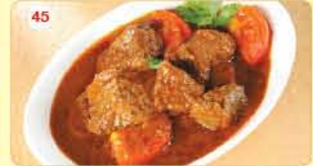
45 ڪاري لحم بالبطاط 2.450