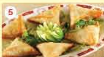
5 0.950 سمبوسك (٦ حبات) Sambousek (6 Pcs.)