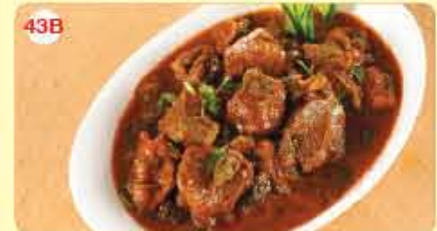
43B ڪاري لحم بالياميٽو 2.200