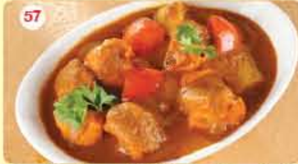
57 Murg Vindaloo 2.400 ڪاري لحم بالبطاط